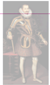
El duque de Lerma

-Acompañada de una excelente red diplomática